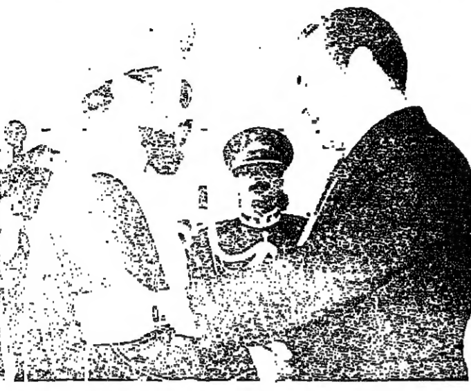
سمو السيد قريشي بن شهاب يودع السيد حسني مبارك

غادر مسقط في الساعة التاسعة من صباح أمس سيادة محمد حسني مبارك نائب رئيس جمهورية مصر العربية بعد زيارة للسلطنة استغرقت يوماً واحداً استقبله خلالها حضرة صاحب الجلالة السلطان قابوس المعظم.